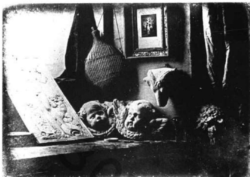
عکس ۱-۴ آلبیهی عکس، لوئی ژاک ماندیه داگر، ۱۸۳۷.