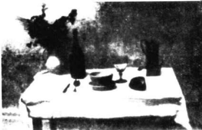
عکس ۱-۱ میز مهیا ژوزف نیسه‌فور نی‌پس، ۱۸۲۲.

۵. «بلوار تمپل، پاریس، ۱۸۳۹» (عکس ۱-۵) که در ژانویه‌ی ۱۸۳۹ رسمن به‌عنوان نخستین عکس «تاریخ معرفی شد» ۲